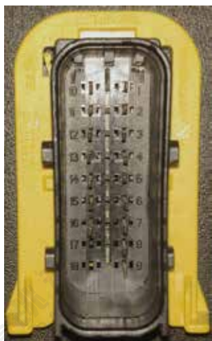
KDS3.1尿素泵侧接头针脚图